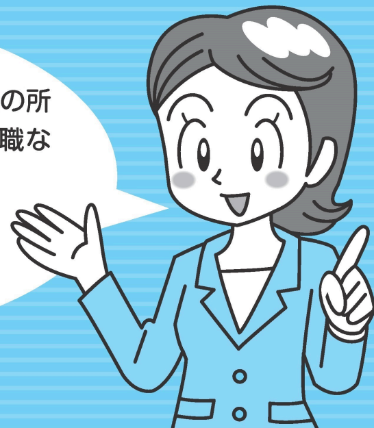
チャート で見る! DC資産の 持ち運び(移換)先

DC は、公的年金に上乗せして老後の所得を厚くする年金制度。退職や転職などをして年金資産を持ち運んで、60歳になるまで積み立てが継続するしくみになっているのよ!