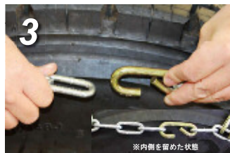
3. 内側フックを留めてください。この際、クロス全体をタイヤ内側に落とし込むと作業しやすくなります。