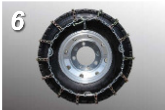
6. 3箇所カムロックを締めるとゆるみが生じる場合は10m前進して再度調整の上、締め直してください。 ※耐久性も大幅に変わりますので、増締めは必ず行って下さい。

上記画像は取り付け方のイメージとなっております。ゴムバンド式、カムロック式共に、実物とは色や仕様が多少異なります。実際はサイドリンクの色は黒、クロスメンバーがシルバーとなっております。上記カムロック式の画像より実際はリンクやラッチ、フック、クロスは小さくなります。取り付け方は同じですので恐れ入りますがご了承の程宜しくお願いいたします。