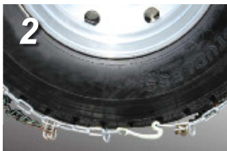
2. 外側のラッチを仮留めし、留めやすい位置まで車を移動します。留具部分を踏まないようご注意ください。