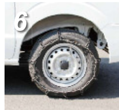
6. 車両を少し前進させ、緩みがある場合は増し締めをします。 ※耐久性も大幅に変わりますので、増締めは必ず行って下さい。