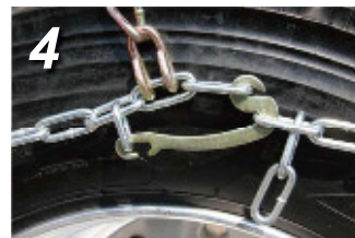
4. 内側が確実に留まっていることを確認した後、外側のラッチ部分を留めます。一本一本クロスが引っかかっているか手で確かめながら引っ張ってください。