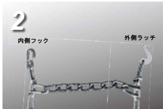
2. フックが内側、S字型のラッチが外側になるように装着します。