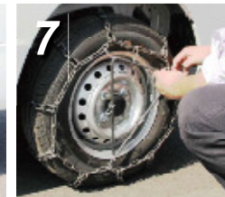
7. 付属のゴムバンドを使い、さらに締めてください。 ゴムバンドのフックを五角形になるようにリンクに掛けていきます。