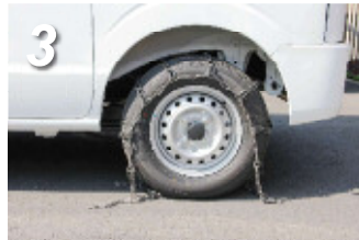
3. クロスメンバーがタイヤトレッドに対して均等になるように調整しながら、タイヤの上から被せてください。内側フックが留めやすい位置まで車両をバックさせます。