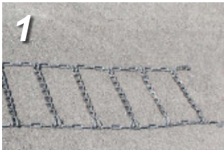
1. タイヤチェーンを広げて裏表を確認し、捻じれが無い状態にします。