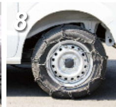
8. ゴムバンドを5ヶ所留めたら装着完了です。