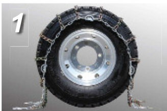
1. タイヤチェーンの裏表を確認して、カムロックがタイヤの外側になるようにタイヤの上から被せてください。クロスメンバーがタイヤトレッドに対して均等になるように調整します。