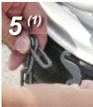
5. (1) 外側のラッチを隣のリンクに通します。