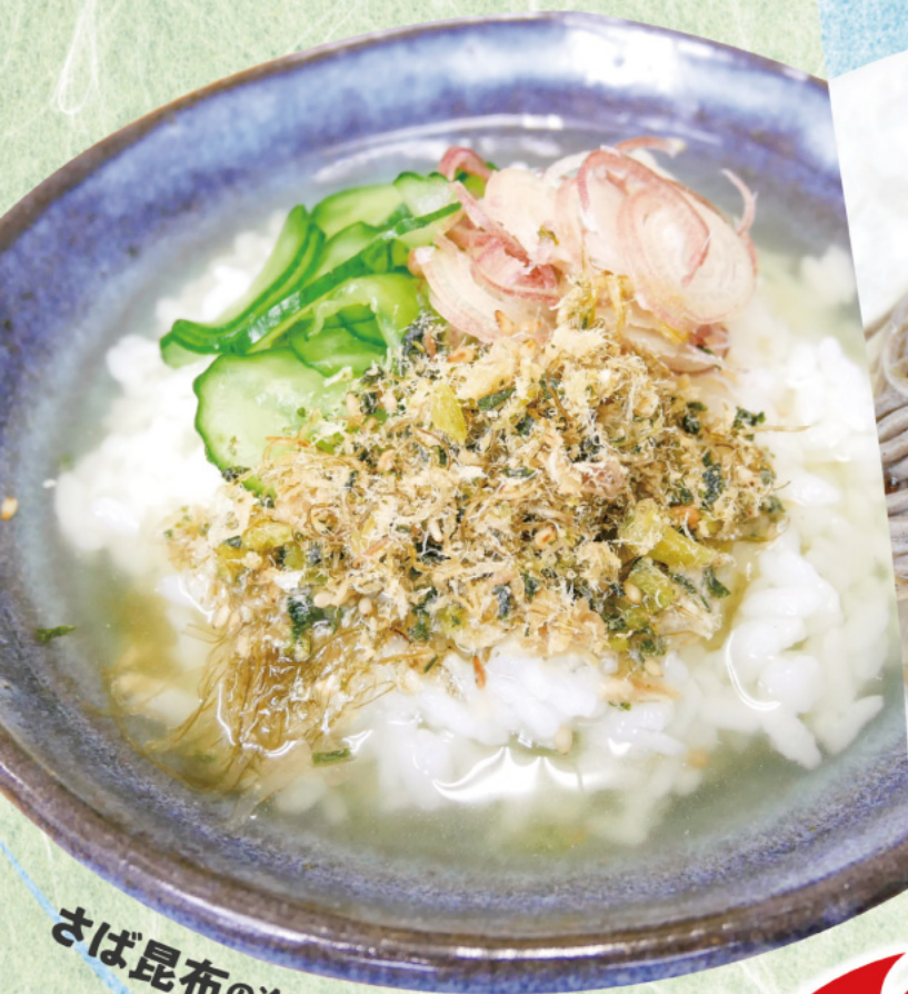
さば昆布の冷やし茶漬け