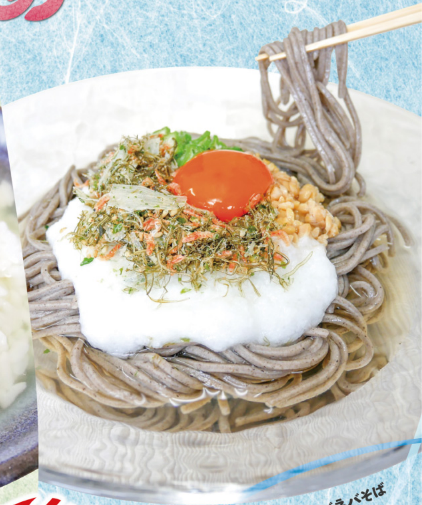
いか昆布のネバナバそば