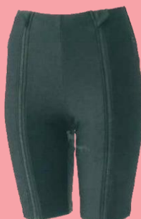
座ったままでも 脱げる水着・下 ¥4,400 (税込)