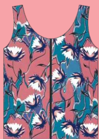
袖なしタイプ ¥8,250 (税込)