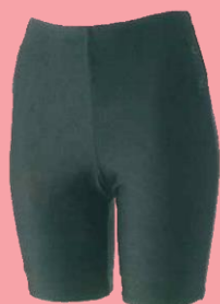
長持ちする 水着・下 ¥3,960 (税込)