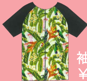
袖付タイプ ¥9,350 (税込)