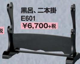
黒呂、二本掛 E601 ¥6,700+税