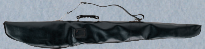
合皮製2振入 大刀用 EFD2 ¥10,700+税 長さ/117cm