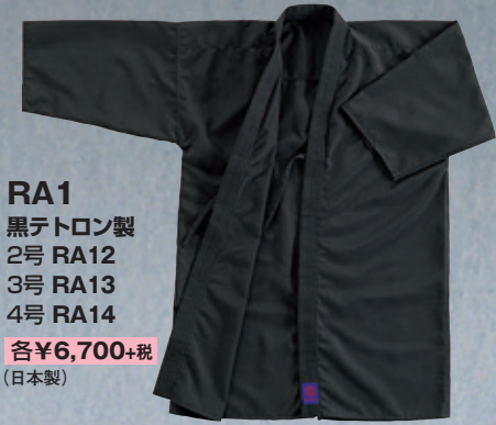
RA1 黒テトロン製 2号 RA12 3号 RA13 4号 RA14 各¥6,700+税 (日本製)