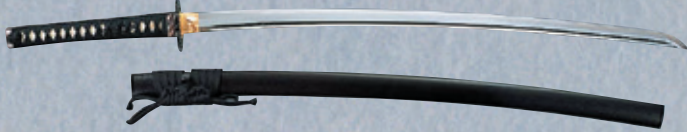
普及品 大刀、石目(2.2~2.45尺) E110 ¥40,600+税 小刀、石目(1.5尺) E111 ¥35,000+税 ※鞘(さや)石目塗 ※刀袋付