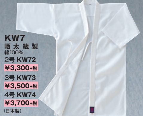
KW7 晒太綾製 綿100% 2号 KW72 ¥3,300+税 3号 KW73 ¥3,500+税 4号 KW74 ¥3,700+税 (日本製)