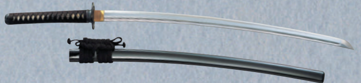
高級品 大刀、同田貫(2.2~2.5尺) E210 ¥109,000+税 小刀、同田貫(1.5尺) E211 ¥106,000+税 ※鞘(さや)黒呂塗 ※刀袋付