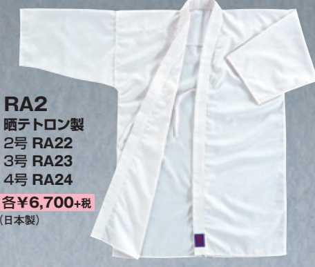
RA2 晒テトロン製 2号 RA22 3号 RA23 4号 RA24 各¥6,700+税 (日本製)