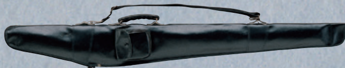
合皮製1振入 大刀用 EFD1 ¥4,500+税 長さ/111cm