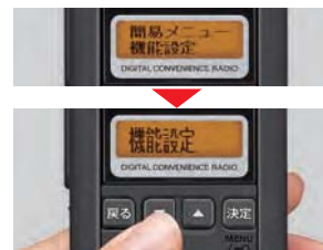
縦倍角メニュー表示

4つのキーによるカンタン操作で、いろいろな機能設定が可能。漢字対応の液晶画面では大きいフォント4文字でチャンネル番号を表示します。よく使う機能設定は最大6文字表示、さらに見やすさを優先した縦倍角表示に切替設定できます。