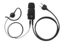
タイプマイク&イヤホン (マイク感度切替付) JSPRN0002 本体価格 6,000円 (税抜)