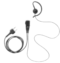
小型タイプマイク&イヤホン JSPRN0001 本体価格 3,800円 (税抜)