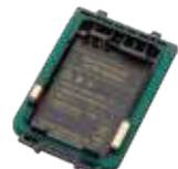
リチウムイオン電池ケース JCPLN0002 本体価格 1,400円 (税抜)