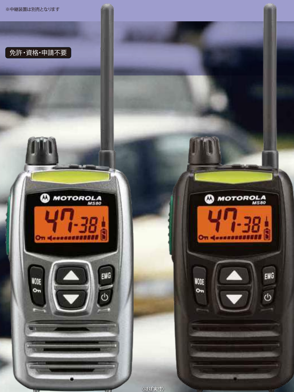
スプレッドシルバー