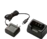
シングル充電器 (ACアダプター付) JCPC N0003 本体価格 2,400円 (税抜)