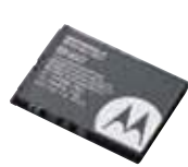
リチウムイオン電池パック (930mAh) BN60 本体価格 3,000円 (税抜)