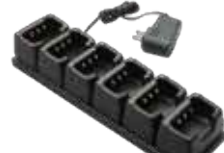
6進型充電器 (ACアダプター付) JCPCN0004 本体価格 18,000円 (税抜)