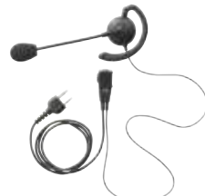
ブームマイクイヤホン JSPRN0003 本体価格 4,800円 (税抜)