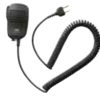
スピーカーマイク JSPMN0001 本体価格 3,600円 (税抜)