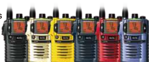
ブラック シルバー イエロー ネイビー レッド ブルー