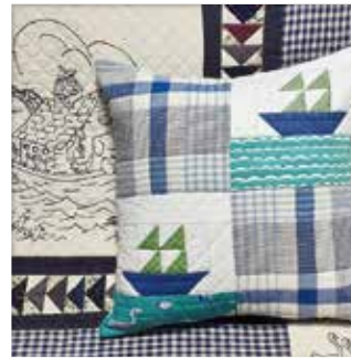
『ヨットのクッション』