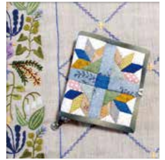
『きれいな花のニードルケース』