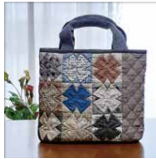
『メイフラワーのバッグ』