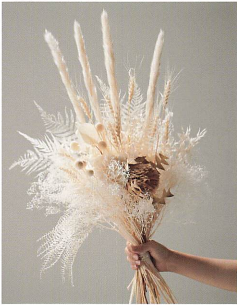
新商品の白いドライ素材でまとめた オシャレな花束