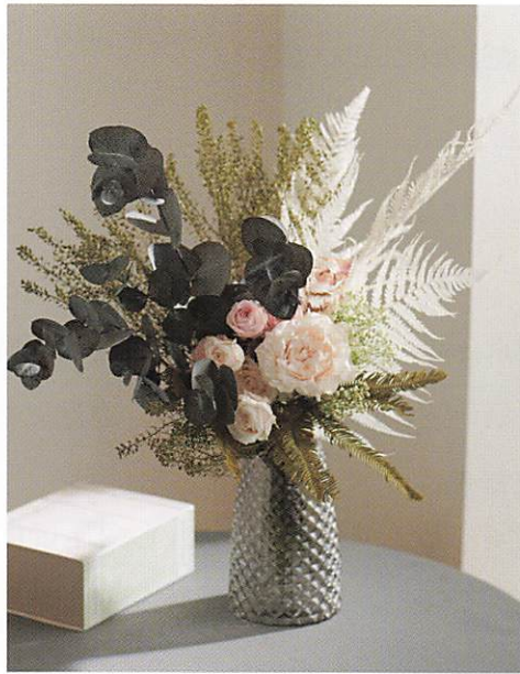
ステム付きのローズと枝物素材で 手軽に作れるインテリアフラワー