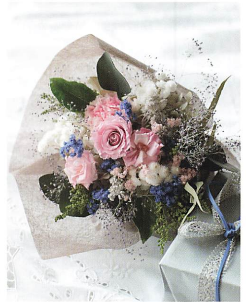
母の日に、プリザ&ドライの ギフト・ブーケ