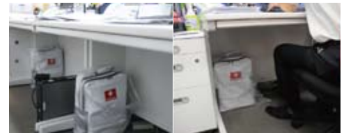
▲白い事務机と、バッグの色が良く調和している。ビニール袋をかけたままにしているのは、「足が当たっても汚れないようにするため」とのこと

としても違和感はありません。 防災セットを購入した目的は、「地震など災害があった時に、社員一人一人の安全を確保するための備え」と、「災害時のお客様対応の備え」の2点です。また、150セットを一度に買った方が、まとめ買い割引効果が期待できたので、このような購入方法をとりました。