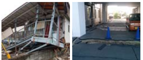
▲震度7の凄まじさが伝わる、倒壊した階段や病院のいたるところにできた大きな段差。

病院は床がグネグネするような感じで大きく揺れ、部屋の中では棚が倒れ、書類や機材などあらゆるものが散乱する有り様でした。電気も水道もダメで病院としての機能は完全に停止し、病室にいた患者さんたちはその後も続いた余震に怯え、本当に不安だったと思います。