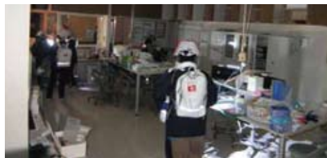
▲被災した院内での復旧作業時には白いバッグに所属と名前を書いて使用した

今回は気候のいい春だったので使わなかったが、冬であれば防寒対策としてアルミブランケットが、雨が降ればレインコートが必要になったと思います。