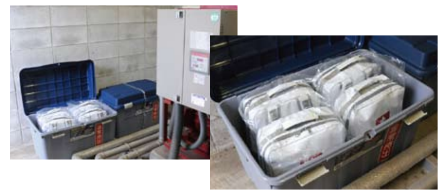
▲鹿沼工場では地震対策30点避難セットを消防ポンプ室に保管

業員はほぼ全員が車で通勤しています。今後ももし地震が起きたとしても、車を使えば、自宅まで帰り着くこと自体は、まずは可能だと予測されます(東日本大震災の時も帰宅困難者は発生しませんでした)。したがって、今回は、帰宅困難者への対策は、最重要視はしませんでした。