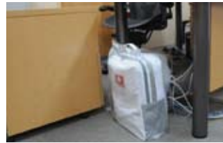
▲社長室では、机の右側に、地震対策30点避難セットを配置。自立型バッグなので、どこにも置ける。