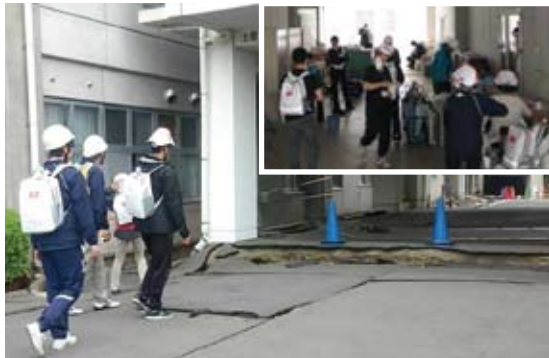
▲本震後の院外・院内の様子。職員全員に避難セットを背負うよう指示。

うちの患者さんの一部は前日に17の病院に転院していただいたのですが、今度は受け入れ先の病院が本震で機能停止となり、また別の病院に移ったという話も聞きました。その病院も備えをしていましたが、この避難セットはなかった。うちが配布した避難セットは非常に便利だったので、その後も患者さんたちは肌身離さずこの避難セットを持っていたということです。震災を機会にこのバッグのデザインはかなり注目され、評判になったと思います。