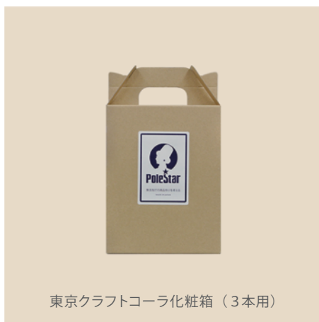
東京クラフトコーラ化粧箱（3本用）