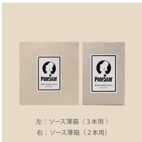
左：ソース薄箱（3本用）