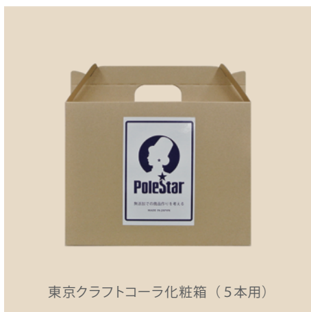
東京クラフトコーラ化粧箱（5本用）