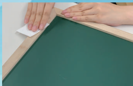
サンドペーパーを使って ヤスリがけをする