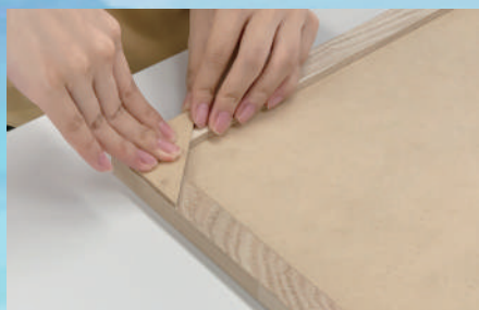
固定部品を木わくの うら面に接着する