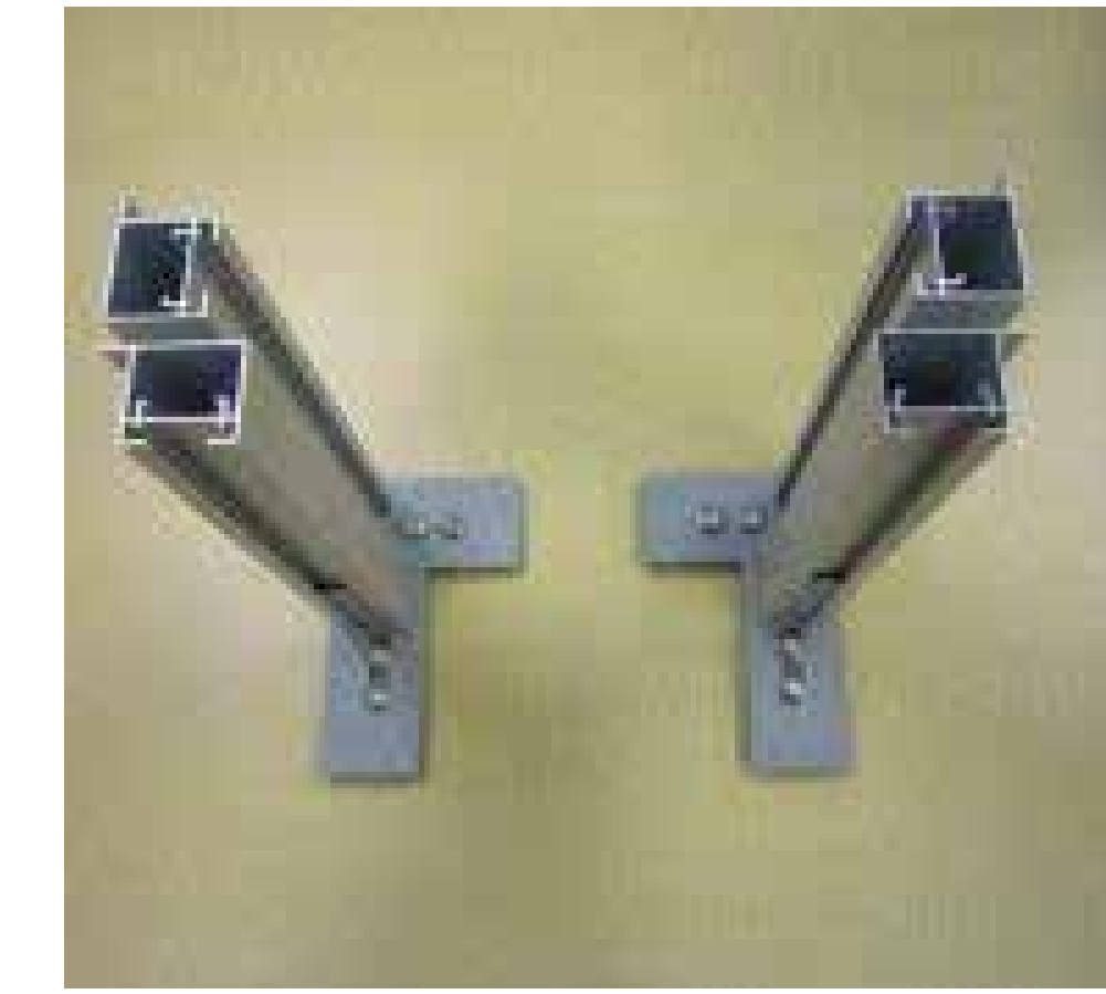
↑コーナーフットキットにBigボードスタンドの支柱を2本取り付けたところ《ボード内貼り・コの字型の場合》