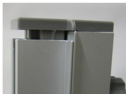
従来品（右）と変更後（左）の上部と 変更後の連結キャップ