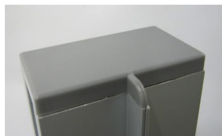
変更後の連結キャップ

連結キャップの形状も変わりますので、従来品と変更後を連結キャップで連結することは出来ません。