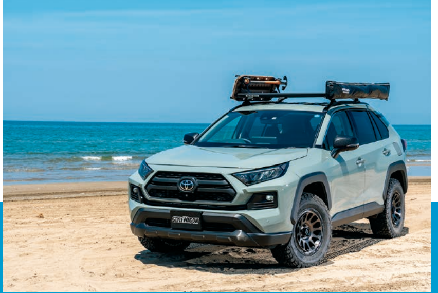
シンプルイズベスト。リフトアップさせた足まわりとホイールに加えて、ルーフラックに付随させたオプションアイテムでオフロードギアらしさをスーパアップさせている。