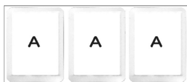
同一商品の セット販売 (例)