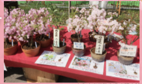
仁和寺専用駐車場 出張店舗

ありあけ ぼよひきり うでん 有明、御衣黄、鬱金 よらきひ なでん 楊貴妃、御殿場、南殿 みくるまかせ しろたえ 御車返し、しだれ、白妙 ふげんそう 普賢象 など