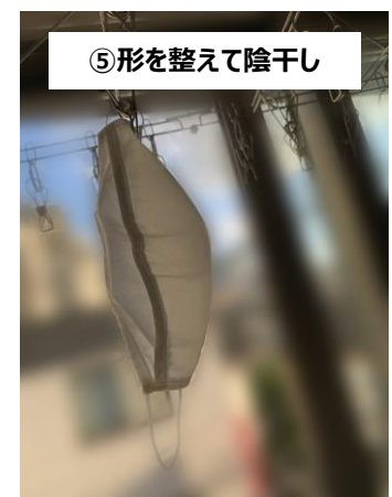
⑤形を整えて陰干し