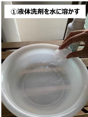
①液体洗剤を水に溶かす