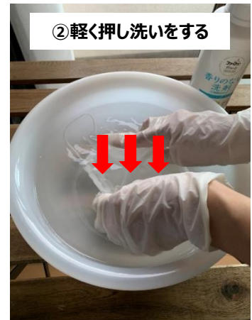
②軽く押し洗いをする