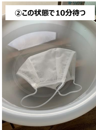
②この状態で10分待つ