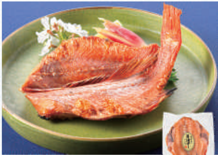
奥能登輪島いしる入 赤魚開き醤油干し