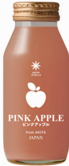
秋田県産 ピンクアップルジュース