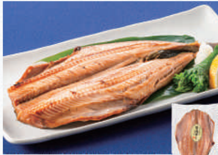
奥能登輪島いしる入 縞ほっけ開き醤油干し