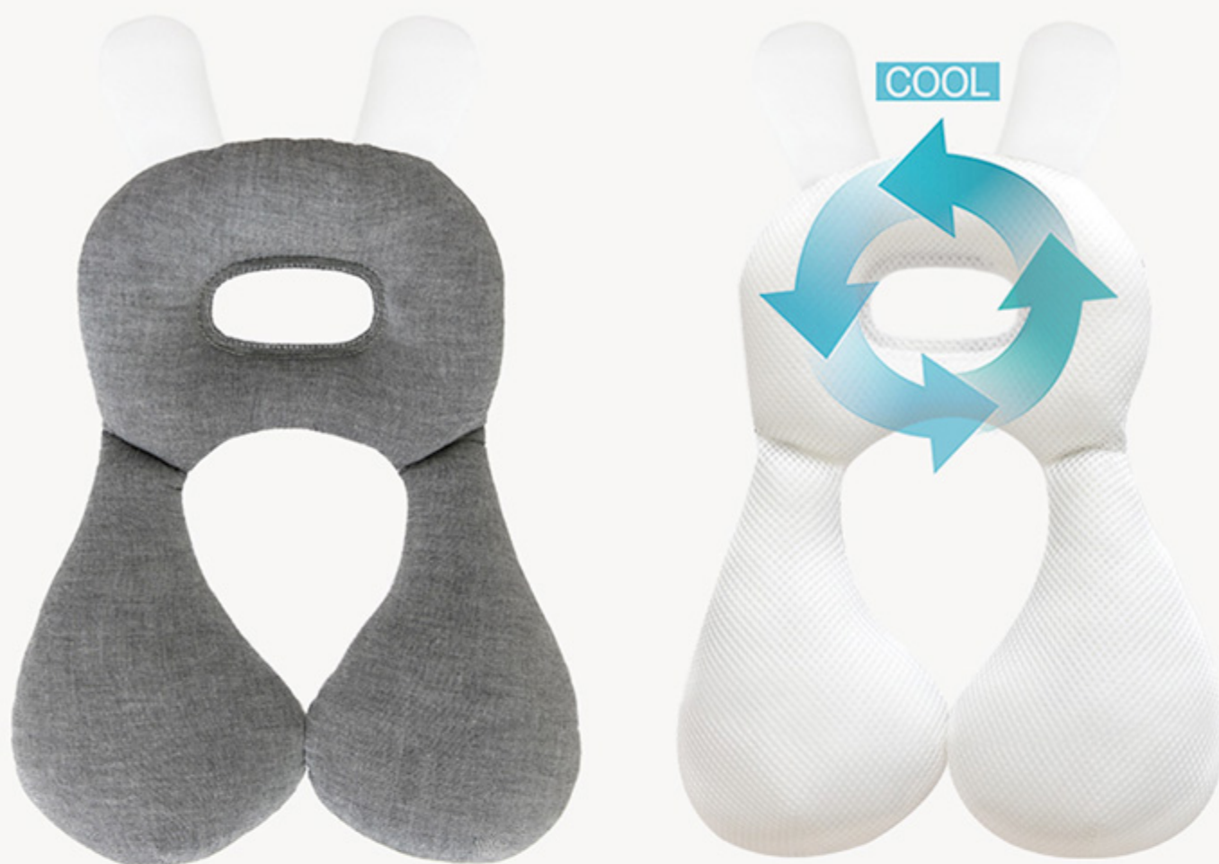
表 - 綿100%

※赤ちゃんの寝返りする力が強くなるとマグネットと留めていても寝返りできてしまう可能性があります。予めご了承ください。