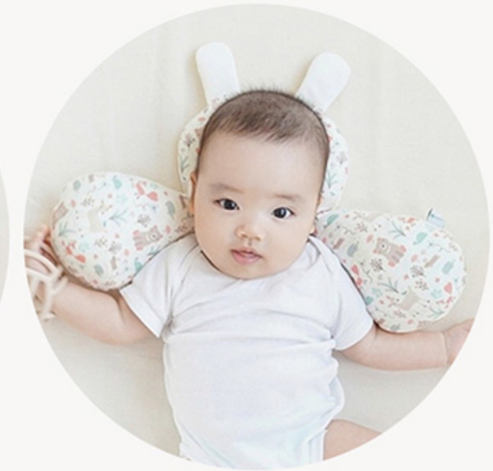
マグネット使用なし

※赤ちゃんの寝返りする力が強くなるとマグネットと留めていても寝返りできてしまう可能性があります。予めご了承ください。