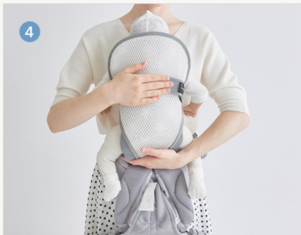
4 クリーンクーラーを装着した赤ちゃんを抱っこします。