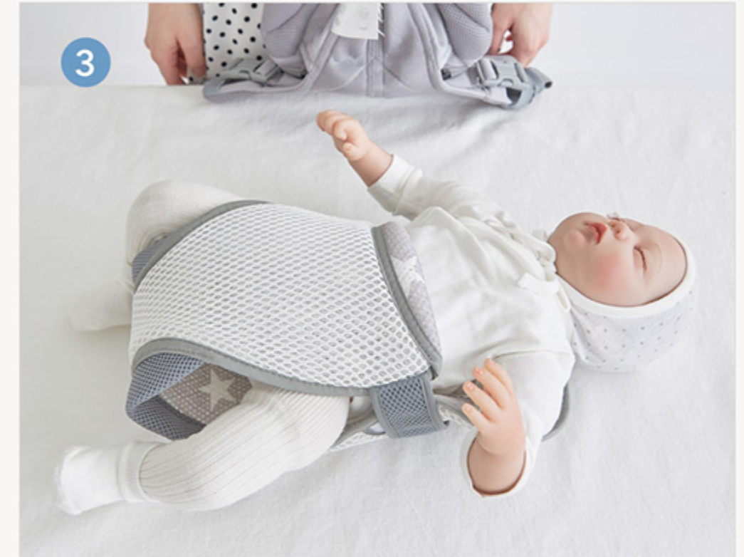
3 反対側のマジックテープも留めます。