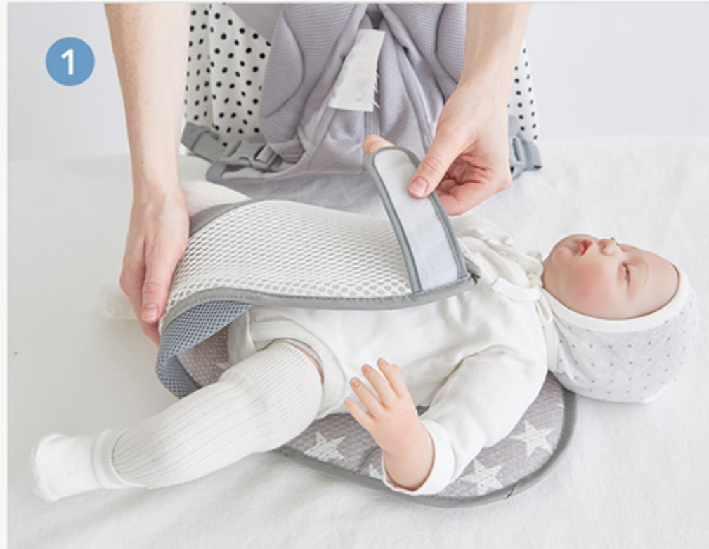
1 クリーンクーラーをおむつを着けるように赤ちゃんの股から引き出し、お腹に被せます。