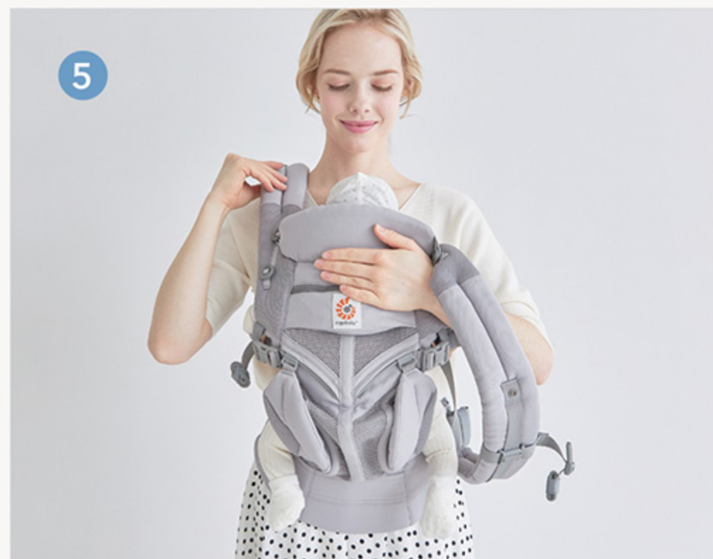
5 通常通り抱っこ紐を装着します。