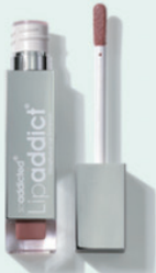
201 Sweet Nothings ベージュ/ラメ有