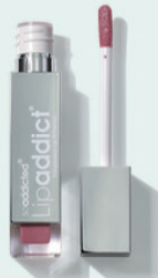
210 Glamour 濃いピンク/ラメ有