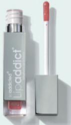
202 Coralista オレンジ/ラメ有