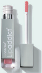
207 Innocence 薄いピンク/ラメ無