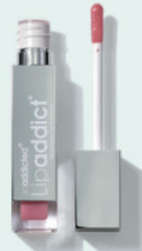
212 Pink Sugar 薄いピンク/ラメ有