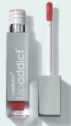
205 Sexy Seductress 濃い赤/ラメ有