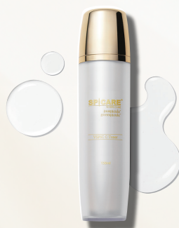
【化粧水】 V3 VSPIC C トナー 130ml 6,600円(税込)