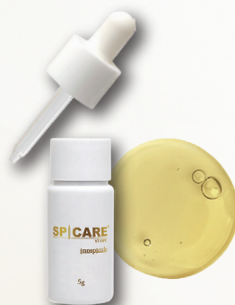
【美容液】 V3 VSPIC 5g×4個 13,200円(税込)