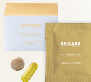
栄養機能食品（ビタミンC） 【ビタミンC含有加工食品】 V3 VSPIC ブライトデリバリーC 1カプセル+1タブレット×30袋 6,480円(税込)