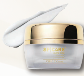
【クリーム】 V3 VSPIC C クリーム 50ml 11,000円(税込)