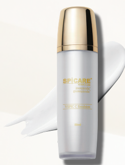
【乳液】 V3 VSPIC C エマルジョン 50ml 8,800円(税込)