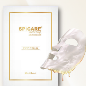
【シートマスク】 V3 VSPIC C マスク 25ml×3枚 2,750円(税込)