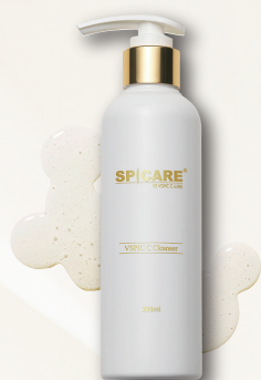
【メイク落とし・洗顔料】 V3 VSPIC C クレンザー 200ml 5,500円(税込)