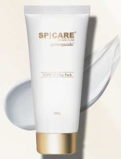
【パック】 V3 VSPIC C クレイパック 200g 7,150円(税込)