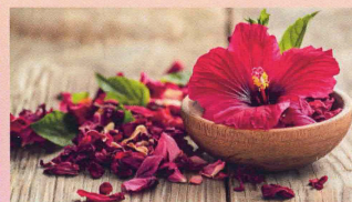
ハイビスカスサブダリファ

レモンバーベナとハイビスカスサブダリファに配合されている豊富なポリフェノールが腸内L細胞の特定の受容体に結合します。この結果、内因性のGLP-1が発現されるため、無理なく、美しい体づくりを行うことが可能なのです。