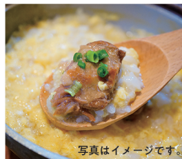
写真はイメージです。