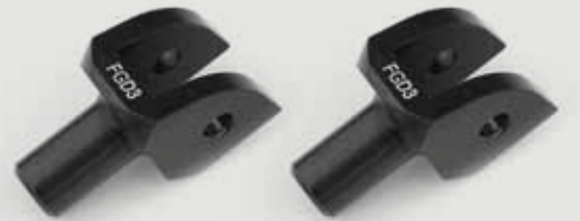
車種別アダプター