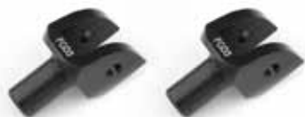
車種別アダプター