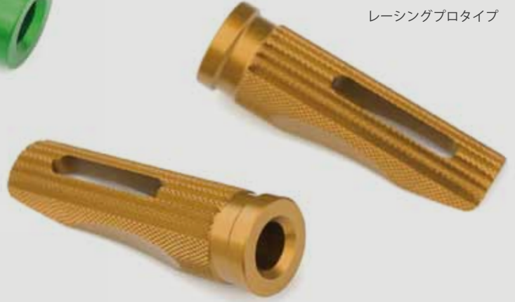
レーシングプロタイプ