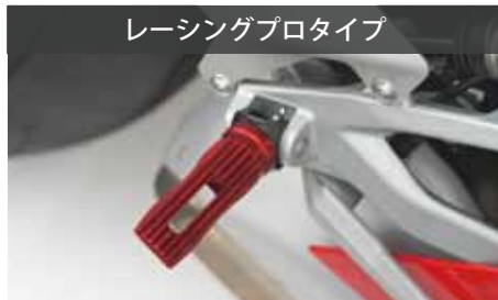
レーシングプロタイプ