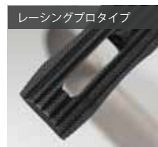
レーシングプロタイプ