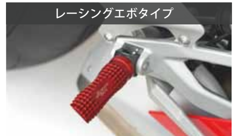
レーシングエボタイプ