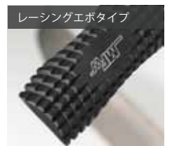
レーシングエボタイプ