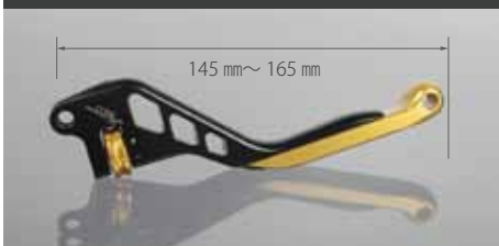
レボリューションタイプ 片側 ¥18,000 (税抜)

工具を使用せず 4 段階にてレバーの長さを調節可能 スタンダードからショートまで最大 20 mm スライド