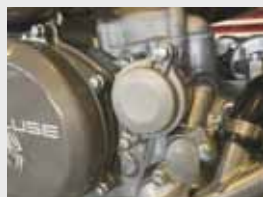
•純正カバーの取付