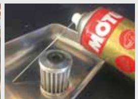
•K&Pフィルターの洗浄