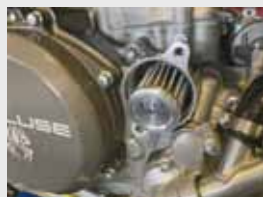
•K&Pフィルターの取り付け