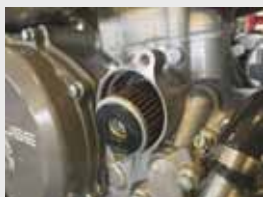
•純正フィルターの取り外し

K&Pフィルター洗浄の際は車両からフィルターを取り外し、パーツクリーナー等でフィルターの洗浄を行います。再度車両へ取付けの際は汚れや水分を十分拭き取ってください。