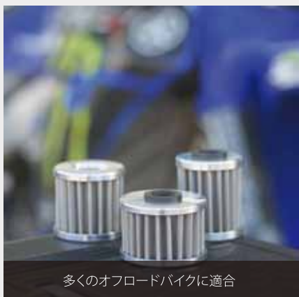
多くのオフロードバイクに適合