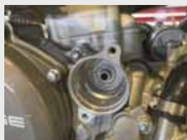
•余分なオイルを拭き取り