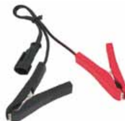
ターミナルクリップ付 200mm