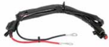
車体側接続コード付 800mm