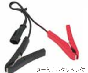
ターミナルクリップ付 200mm