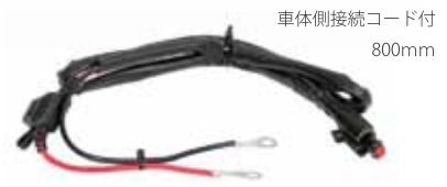
車体側接続コード付 800mm