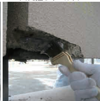
エポキシ樹脂モルタルのプライマー