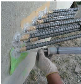
アンカーボルトの定着