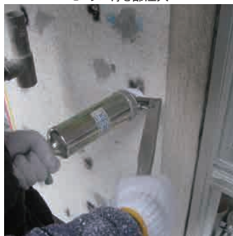
モルタル浮き部注入