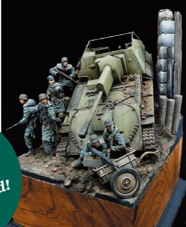
Model by Greg CHILAR