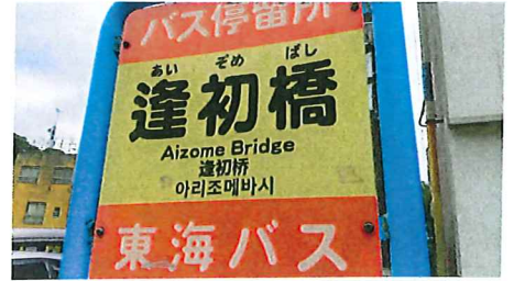
図1-4 バス停留所「逢初橋」