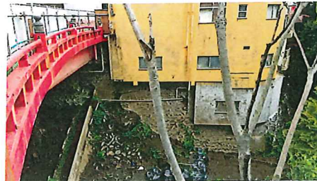
図1-3 逢初川にかかる逢初橋