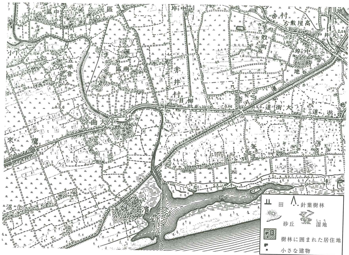
【図6】 1910年代の石巻市周辺