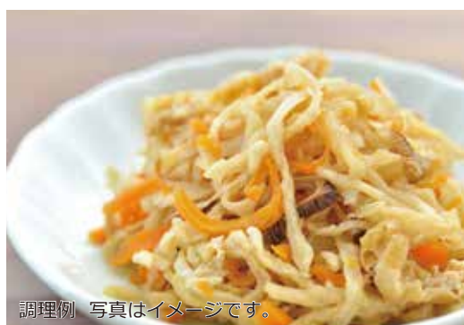
調理例 写真はイメージです。