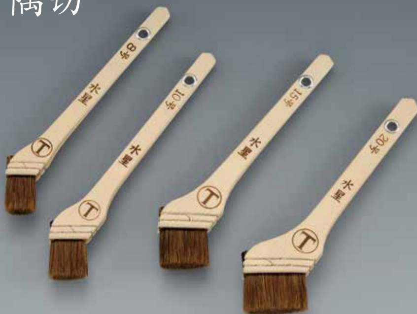
● 水星 隅切 (赤毛) 天尾