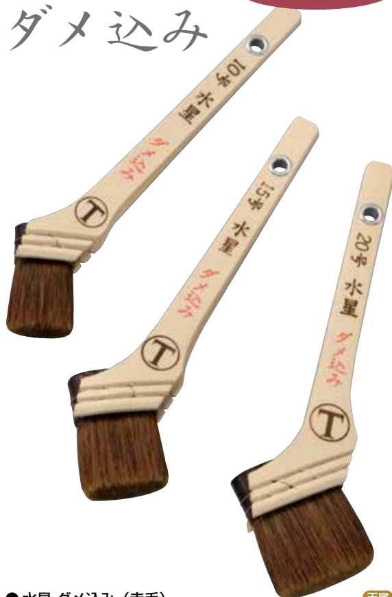
● 水星 ダメ込み (赤毛) 天尾