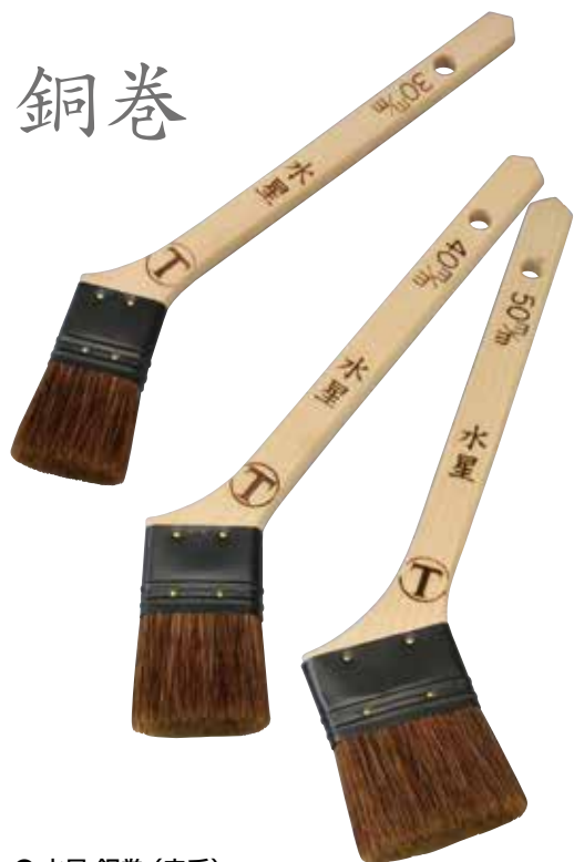
● 水星 銅巻 (赤毛) 天尾