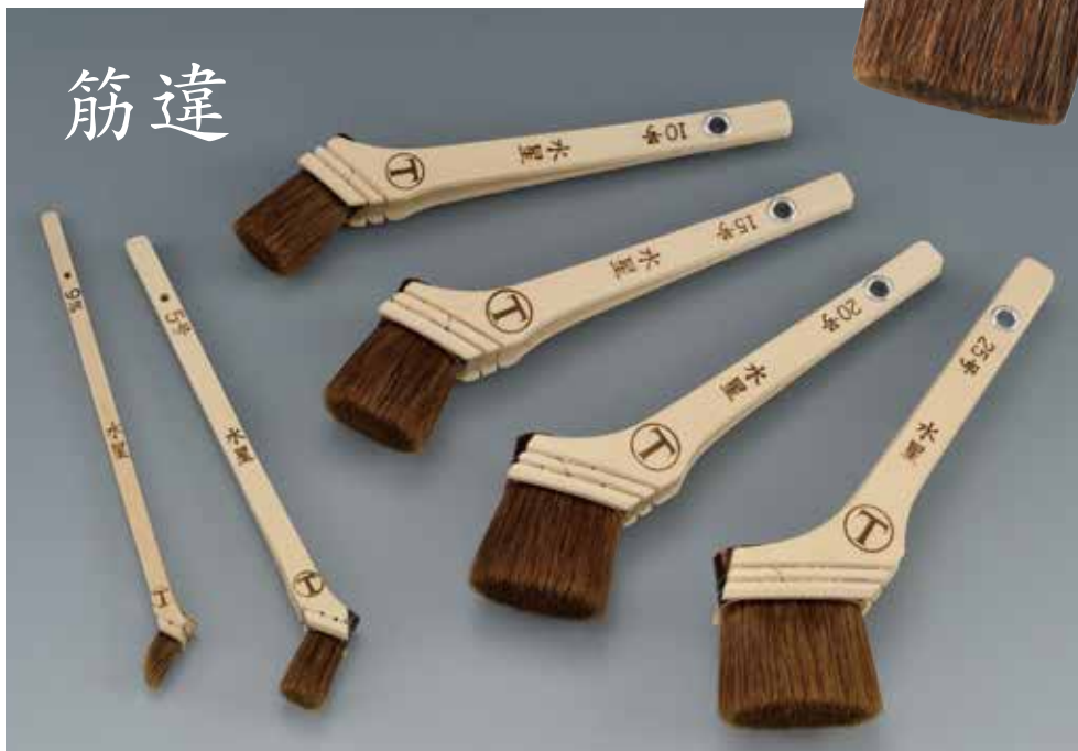
●水星 村切 (赤毛)