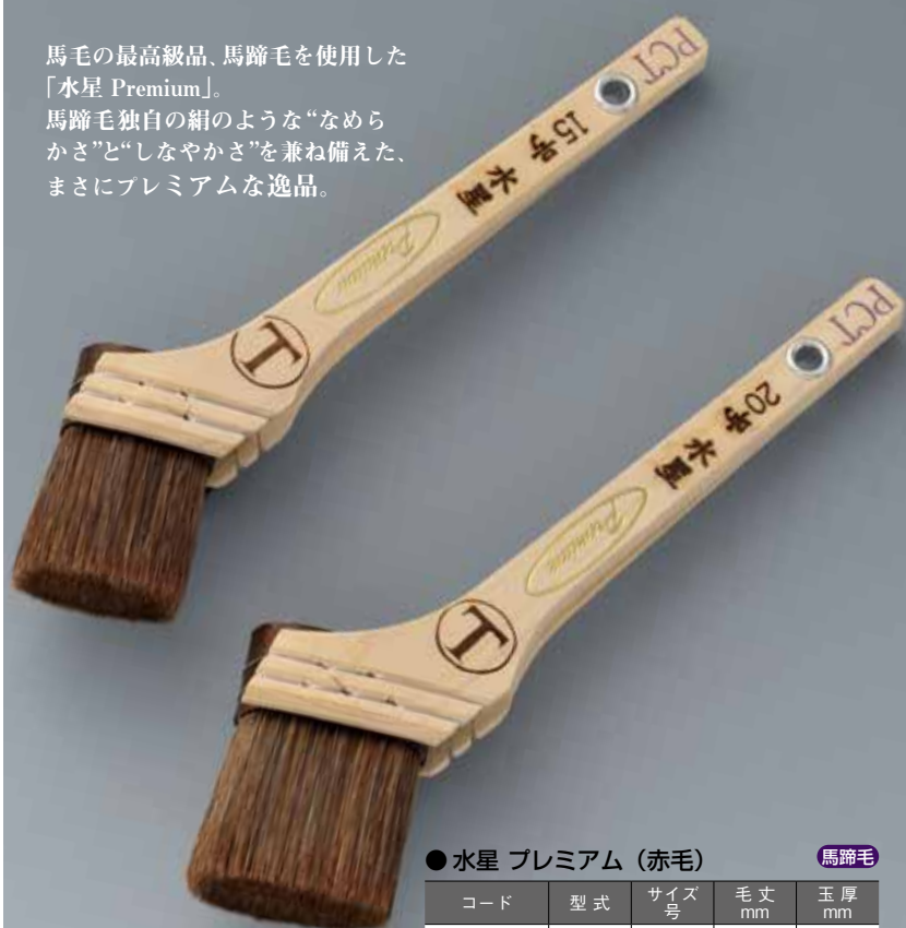
● 水星 プレミアム (赤毛) 馬蹄毛

馬蹄毛独自の絹のような“なめらかさ”と“しなやかさ”を兼ね備えた、まさにプレミアムな逸品。