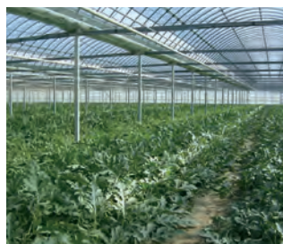
静岡県 ハウス栽培