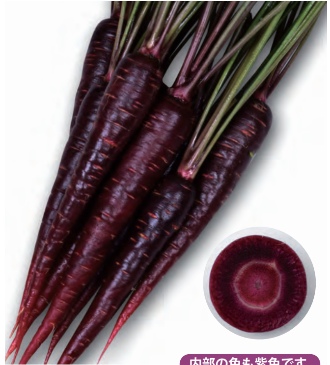
内部の色も紫色です。