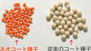
↑ ネオコート種子 ↑ 従来のコート種子

ハーモニーシリーズの販売は全てネオコート種子になります。薄くコーティングされており播種しやすい形状で、土との識別がしやすいように着色されています。大きさは左図のように、一般的なコート種子より小さいタイプです。お持ちの播種機に対応できない可能性がありますので、ご購入の前に確認をお願い致します。