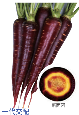
一代交配 バイオレットハーモニー