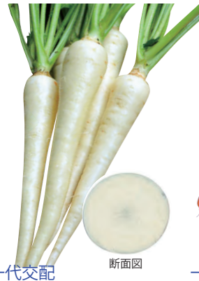
一代交配 ホワイトハーモニー