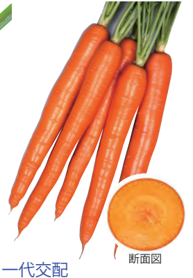
一代交配 オレンジハーモニー