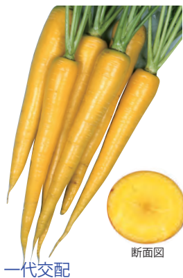
一代交配 イエローハーモニー