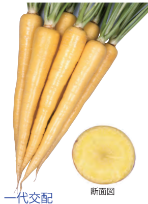
一代交配 クリームハーモニー