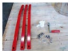
組立用の部品各種例