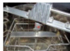
上から中のシャフト を見た場合