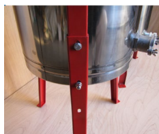
足部品は、取り付けなくても本体を直置き しても使用が可能です。足は必要に応じて 取り付けてください。