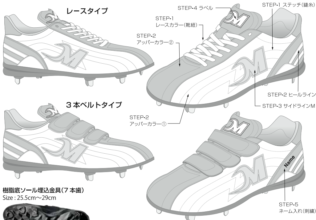
樹脂底ソール埋込金具(7本歯) Size: 25.5cm~29cm

下記一覧のアッパーとソールを選択してください。*アッパー素材は軽くて丈夫なソフトエナメルになります。