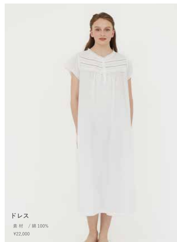
ドレス 素材 / 綿100% ¥22,000