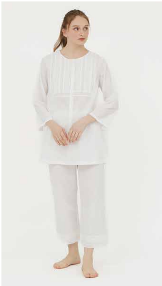
パジャマ 素材 / 綿100% ¥27,500