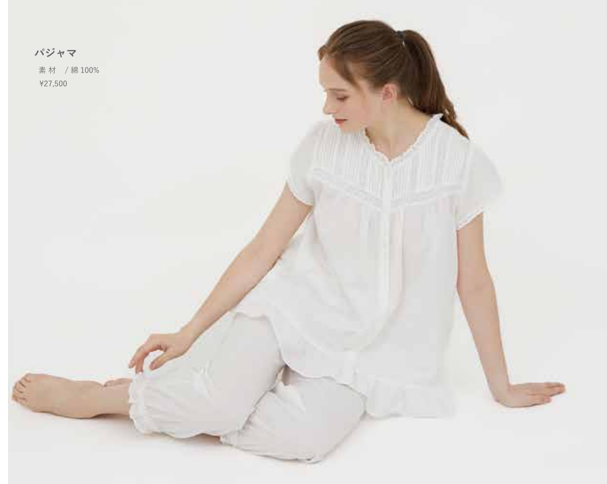
パジャマ 素材 / 綿100% ¥27,500