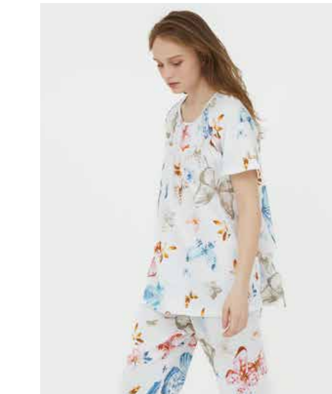
パジャマ 素材 / トップス：綿 50%・レーヨン 50% ボトムス：綿 48%・レーヨン 47%・ポリウレタン 5% ¥53,900