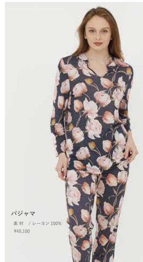
パジャマ 素材 / レーヨン 100% ¥45,100