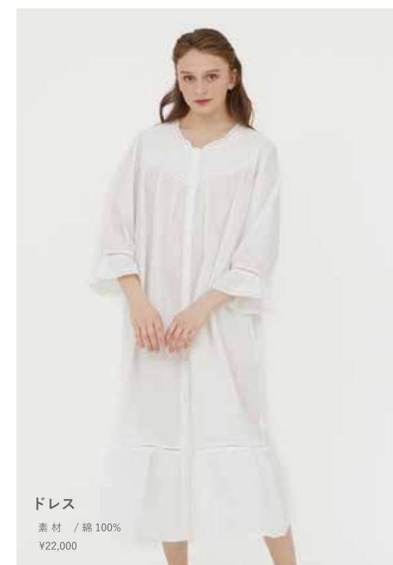
ドレス 素材 / 綿100% ¥22,000