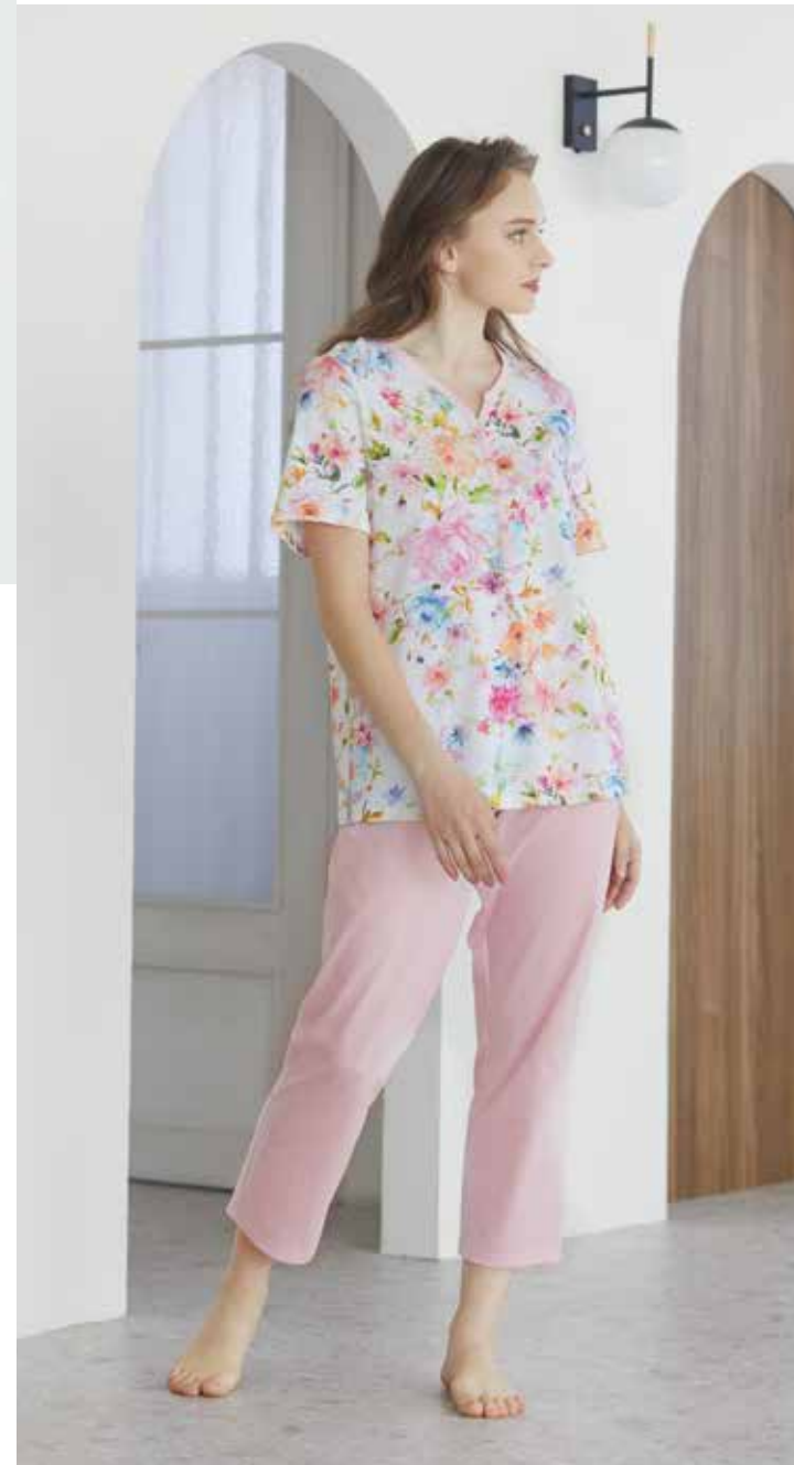
パジャマ 素材 / 綿 100% ¥33,000