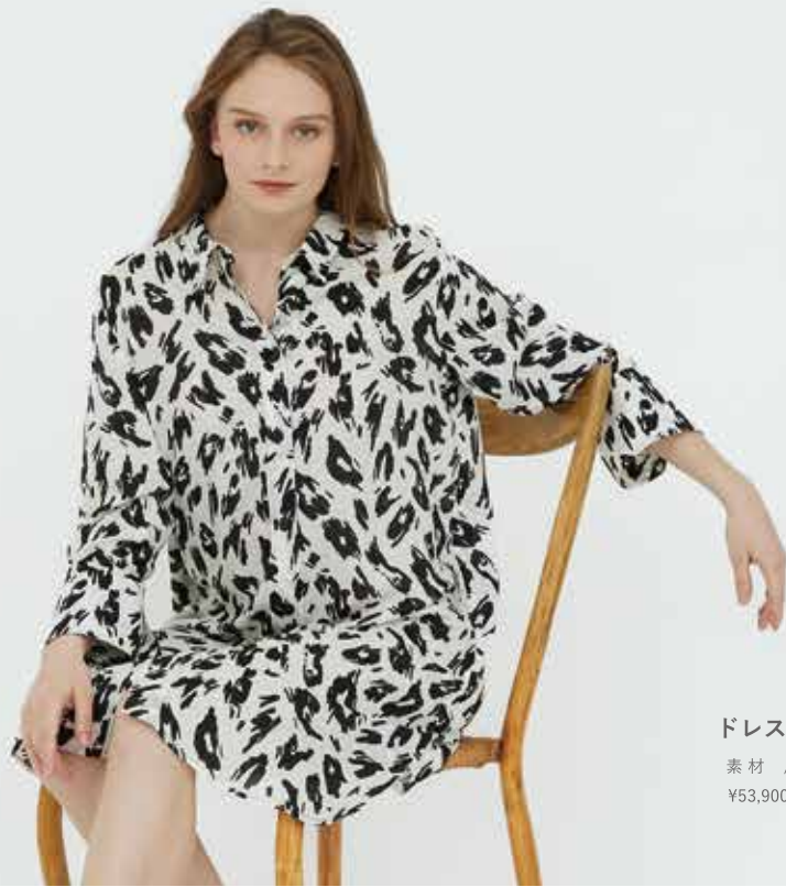
ドレス 素材 / レーヨン 100% ¥53,900