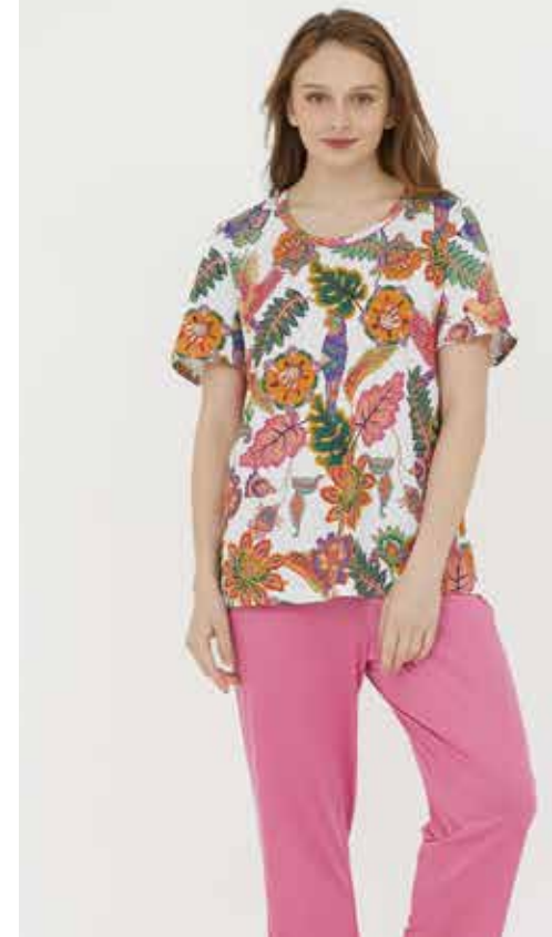
パジャマ 素材 / トップス：綿 100% ボトムス：綿 50%・レーヨン 50% ¥30,800