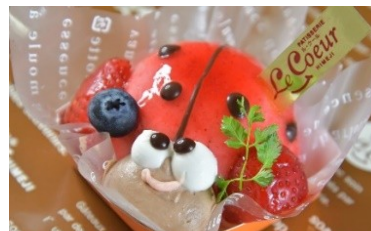
てんてん 1個 498円