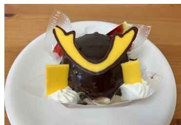
カブトまる 1個 498円