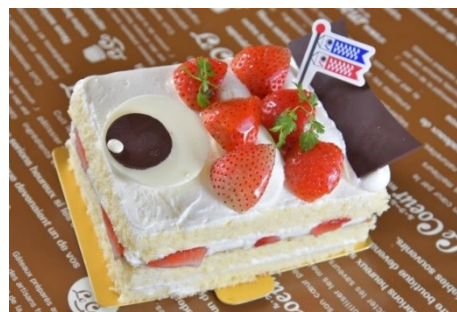
こいのぼりケーキ(12cm)2,200円