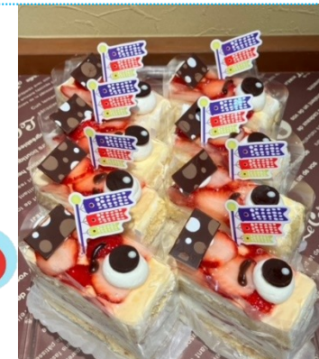
こいのぼりショート 498円