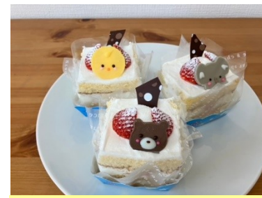
アニマルショート 498円