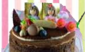
C: 蒸し焼きショコラ