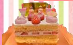
A: ショートスクエアケーキ