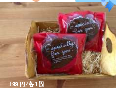
チョコマドレーヌ