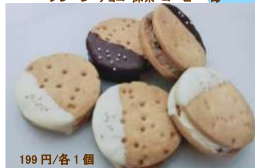
バターサンド ～プレーン・チョコ・抹茶・コーヒー・苺～