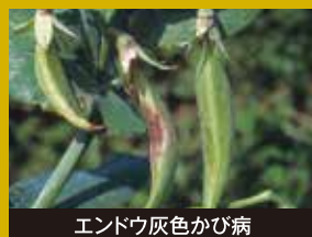
エンドウ灰色かび病