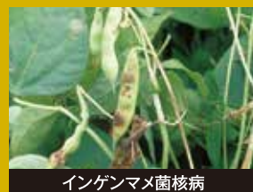
インゲンマメ菌核病