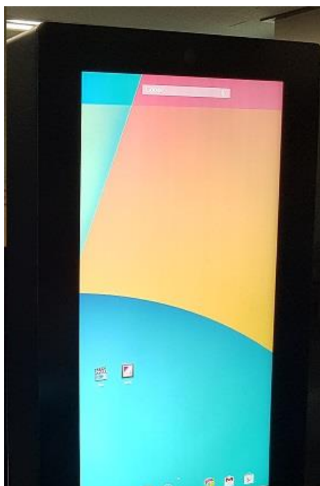
強化乱反射防止ガラス（5mm）を採用しております。 視野角は178度となります。