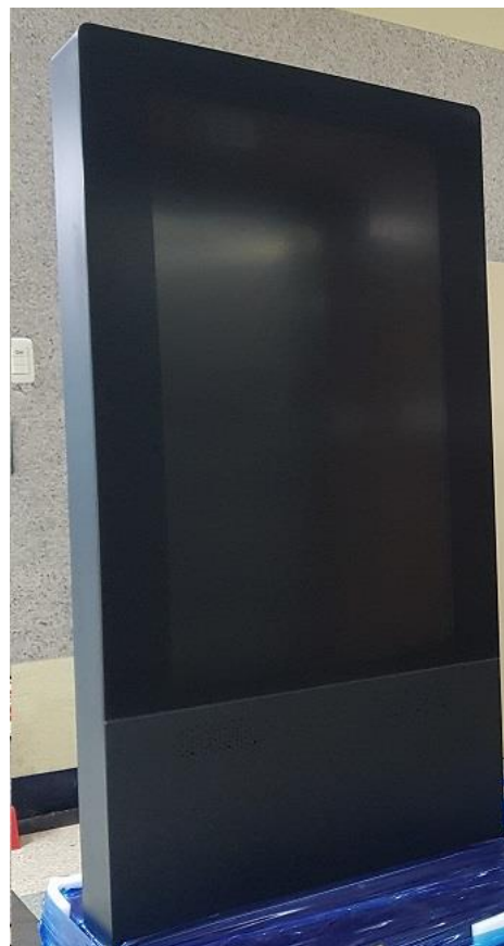
前面左右にパンチングのスピーカー穴があります。 10w×2個となります。