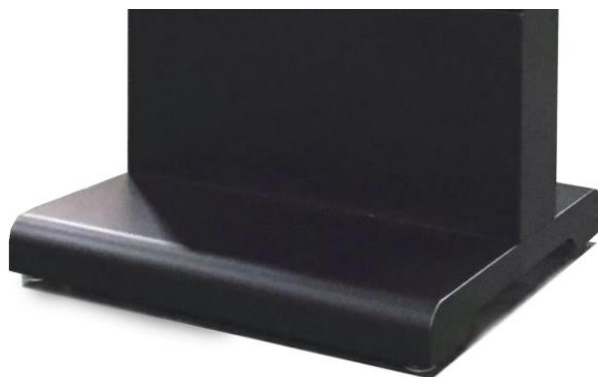
台座の仕上がりです。 台座下にはキャスター（ストッパー付）がついています。