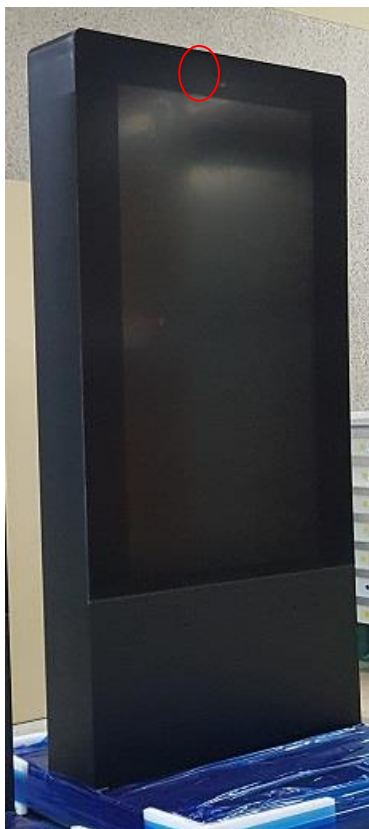
上部赤丸部にリモコン受光部があります。