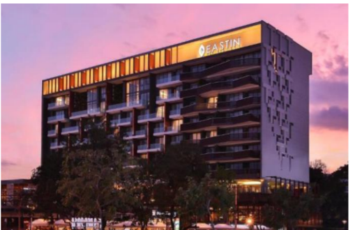
グランドビスタホテル チェンライ