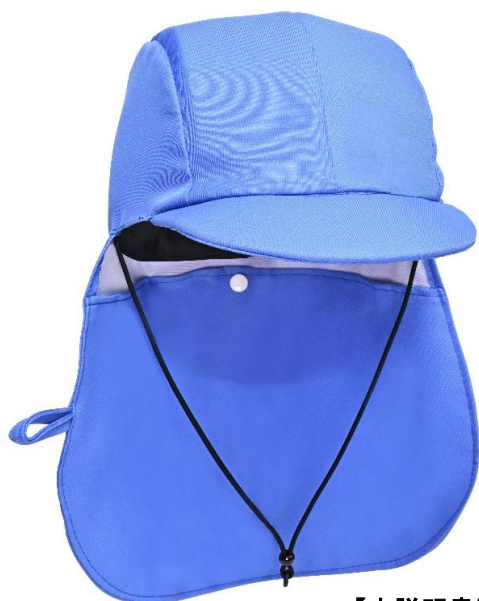
【本説明書に該当する製品】 ・KM-1000X (防災ヘッドガード)

この度は、「防災ヘッドガード」をお買い上げいただき、誠にありがとうございます。 ご使用前に、本体表示及び本説明書を必ず十分にお読みいただき、正しくご使用ください。 また、本説明書は正しいご使用ができます様、お読みになられた後も大切に保管してください。