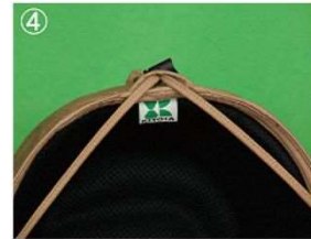
④ループとドロコードで固定