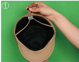
①あごひもを帽子の後ろ側へ