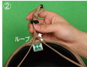
②あごひもを下からループへ通す