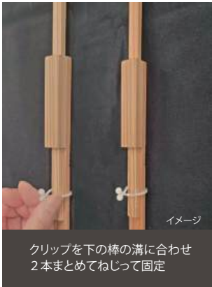
クリップを下の棒の溝に合わせ 2本まとめてねじって固定