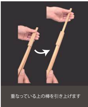
重なっている上の棒を引き上げます