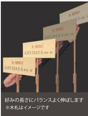
好みの長さにバランスよく伸ばします ※木札はイメージです