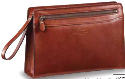
■ No. 25884