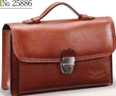
■ No. 25886