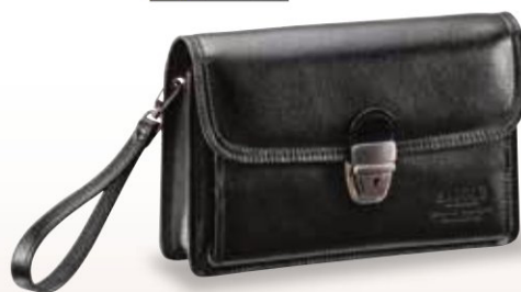
■ No. 25887