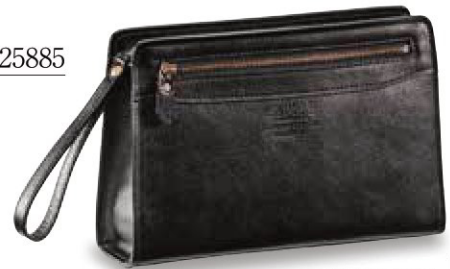
■ No. 25885